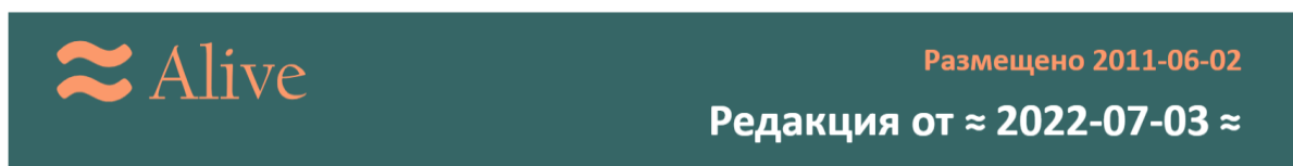
Рис. 1. Баннер живой публикации. Указаны дата первого размещения и дата текущей (свежей) редакции

Как читателю отличить живую публикацию от статичной? Просто добавить к ее представлению специальный значок «Публикация объявлена живой», очевидно, недостаточно. Ведь автор мог когда-то поставить этот значок и благополучно забыть и о нем, и о своем онлайн-тексте. Поэтому единственное достоверное свидетельство живой публикации — свежая дата ее последней редакции. Эта дата безусловно демонстрируется на заметном месте основного текста, например, в форме баннера, бросающегося в глаза (рис. 1).